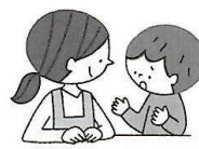
悩みがあるとき 相談できる