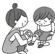
ケガをしたとき 救急処置してもらえる

けがをした時や具合が悪くなってしまう時は、先生にことわってから、保健室に来てください。（緊急時を除く）。そのときは、「ほけんしつ」の約束を守ってくださいね。