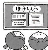
健康について 知りたいとき