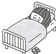
具合が悪いとき 一時的に休養できる